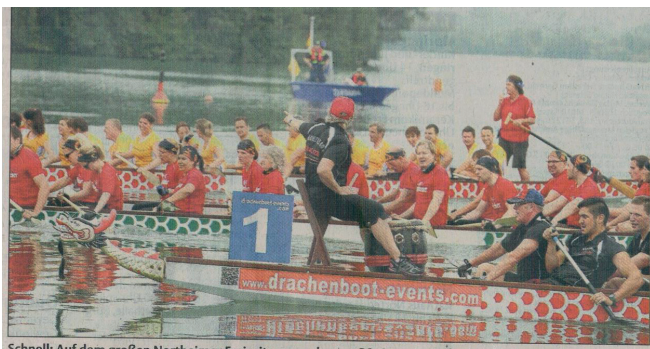
Schnell: Auf dem großen Northeimer Freizeitsee werden am 20. August wieder Drachenboote über das Wasser geleitet.