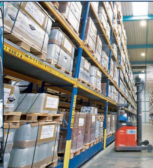
Modernste Technik: unter anderem durch Schnellentladesysteme